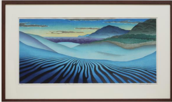
風紋 47 大久保 勇 76歳 焼津市