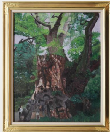
樹令2000年の 息吹 木下萬里子 74歳 裾野市