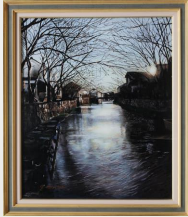
八幡堀 水谷 裕子 68歳 浜松市中区