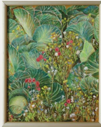
キャベツ畑の野花 杉山 勝良 72歳 静岡市葵区