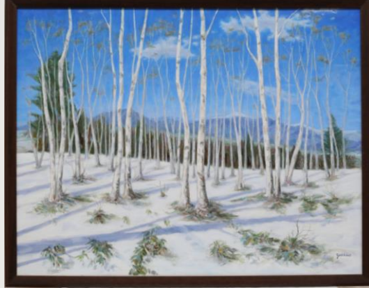
早春に立つII 望月 保男 68歳 焼津市