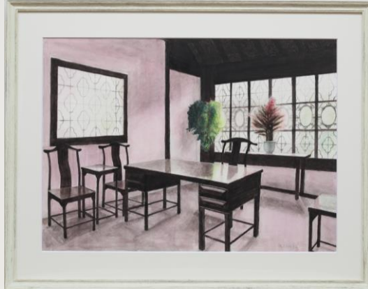
窓のある部屋 諸田史恵子 65歳 川根本町