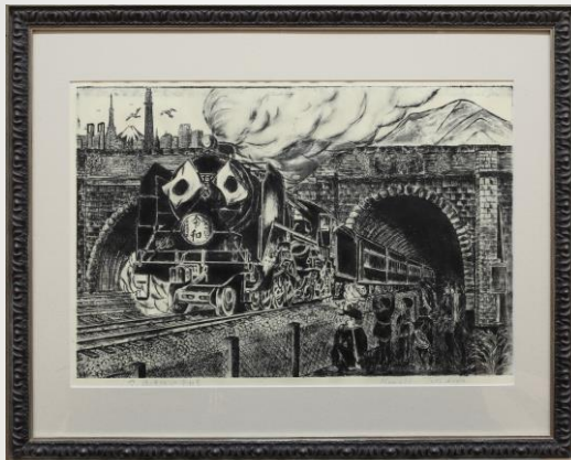
力、強く走りだ した令和号 高島 邦明 78歳 沼津市