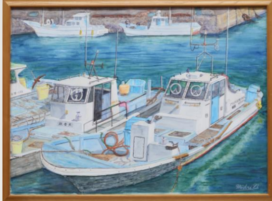
漁を終えて 中野みどり 70歳 菊川市