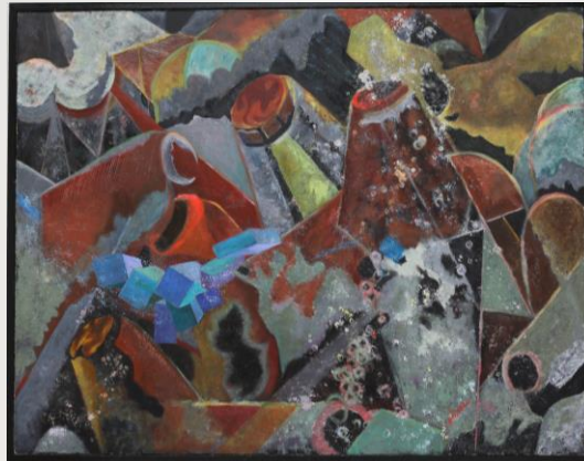
KATATI 増田 久恵 69歳 御前崎市