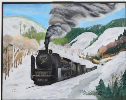
慕進 由井 捷夫 82歳 静岡市駿河区