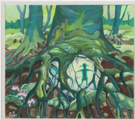
光苔 溝口 博之 80歳 掛川市