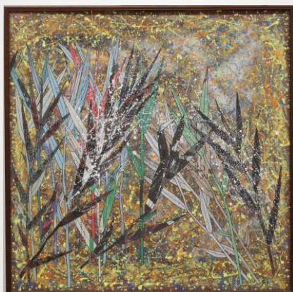
葦の華 赤堀 静子 80歳 掛川市