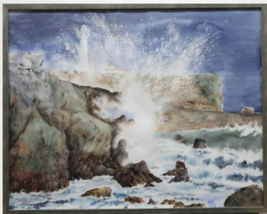
初恋 岡本 雪江 70歳 菊川市