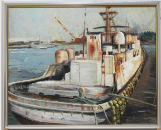
よく頑張ったな 藤牧 正弘 79歳 焼津市