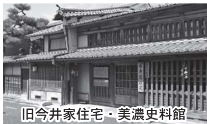
旧今井家住宅・美濃史料館

また、毎年 10 月に開催される美濃和紙あかりアート展は、1300 年の伝統を誇る「美濃和紙」と江戸時代からの情緒を残す「うだつの上がる町並み」のコラボレーション。数多くの独創的なあかりの作品が展示され、町並みは幻想的な世界に包み込まれます。