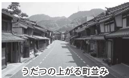
うだつの上がる町並み