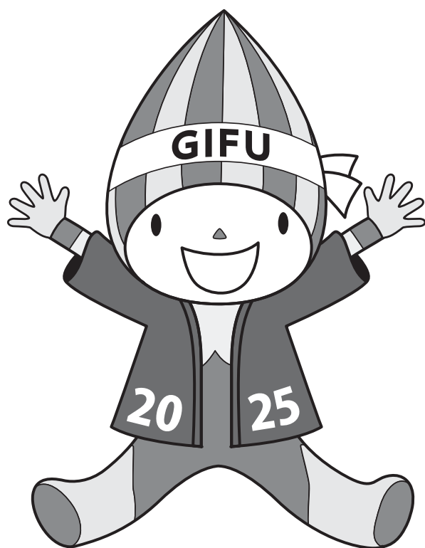
大会マスコットキャラクター 「ミナモ」