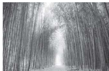
木曾川渡し場遊歩道 （かぐや姫の散歩道）