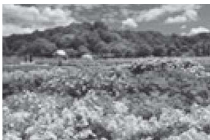
ぎふワールド・ローズガーデン