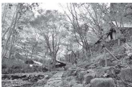
美濃桃山陶の聖地 （荒川豊蔵資料館）