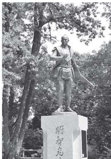
明智光秀生誕地 （明智城本丸跡）