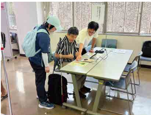
SOMPO ひまわり生命保険(株)

実施内容 ベジチェック測定、ブローゴルフ体験、AI姿勢チェック、握力測定、資料配布