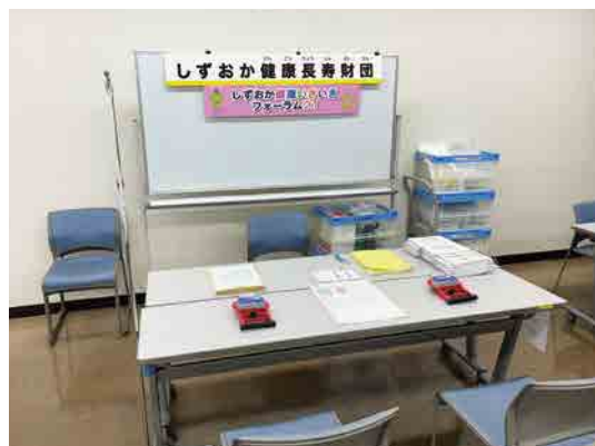
しずおか健康長寿財団