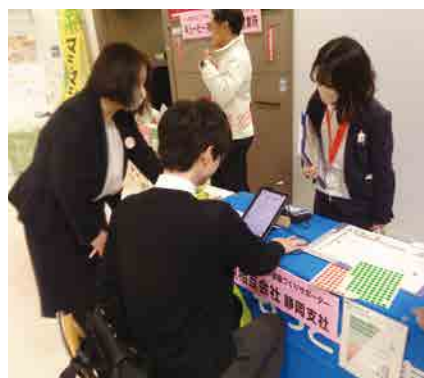
日本生命保険相互会社