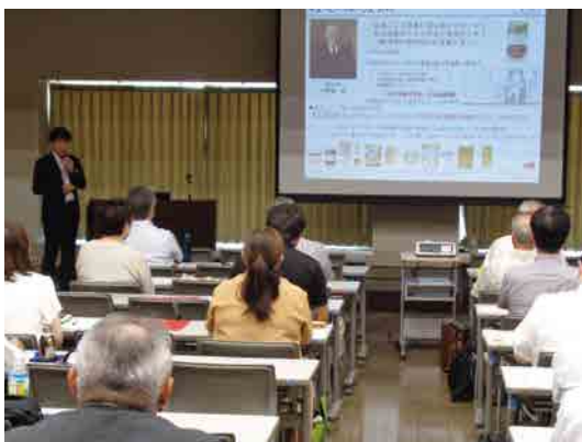
新サポーター紹介