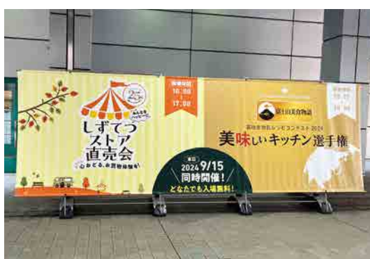
最終審査会場 (ツインメッセ静岡)