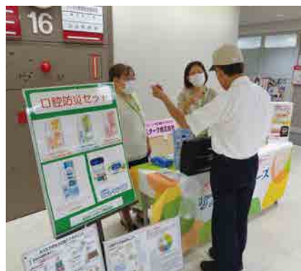
雪印ビーンスターク(株)