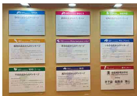
各市長からの応援メッセージ