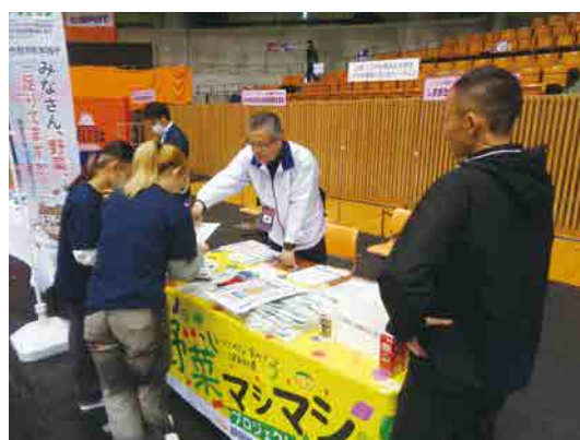
しずおか健康長寿財団