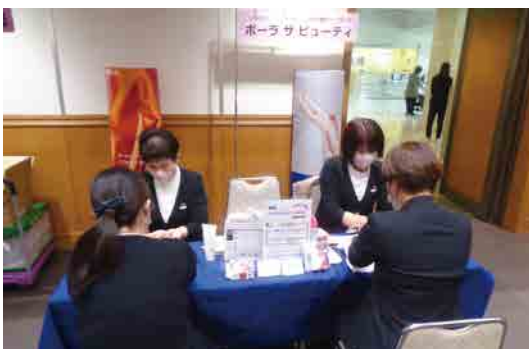
ポーラザビューティ SBS 通り店