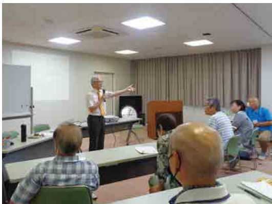
森町保健福祉センター