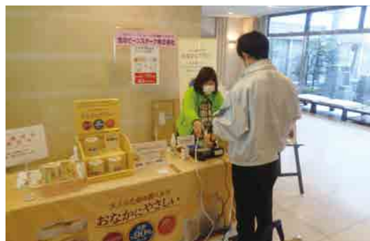
雪印ビーンスターク(株)