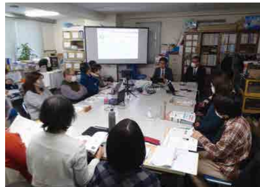
SOMPO ひまわり生命保険(株)