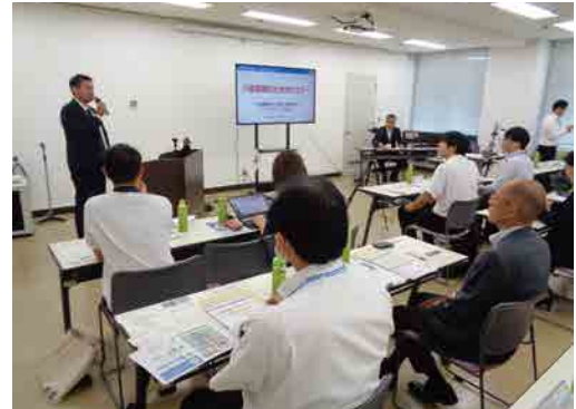
(一社)日本顧問介護士協会