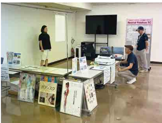
Neutral Position TC