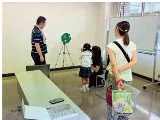
日本ブローゴルフ協会