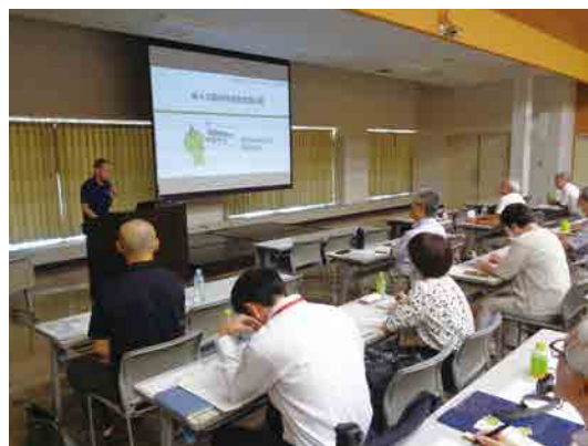
第4次健康増進計画説明