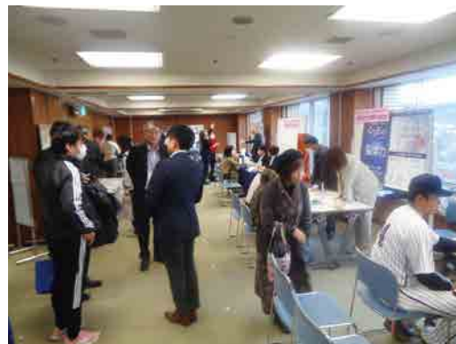
ブース展示の状況