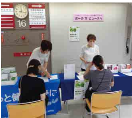
ポーラザビューティ SBS 通り店