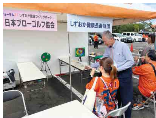
日本ブローゴルフ協会