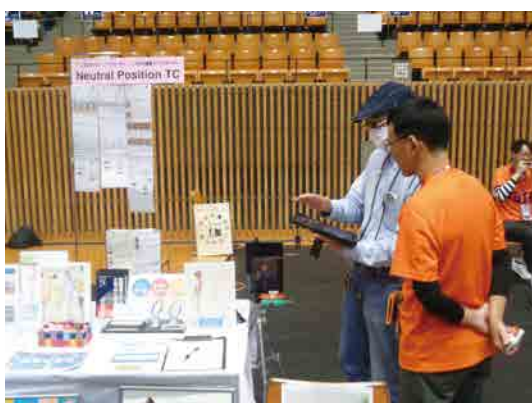
Neutral Position TC