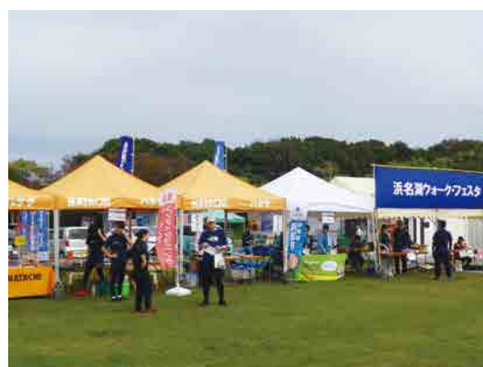
参加企業のブース