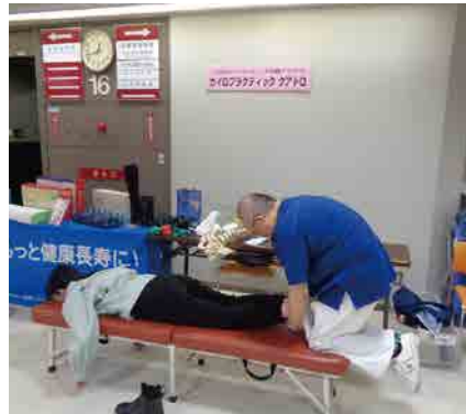
カイロプラクティックアトロ