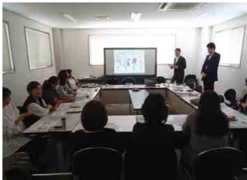
明治安田生命保険相互会社