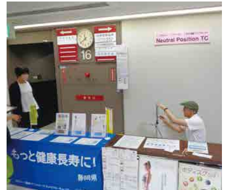
Neutral Position TC