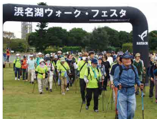
ウォーキング出発