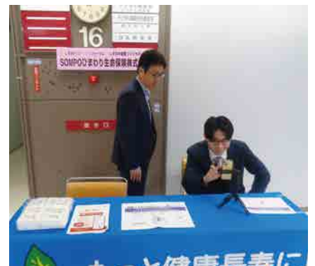
SOMPO ひまわり生命保険(株)