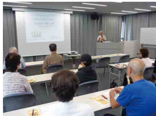
道の駅開国下田みなと